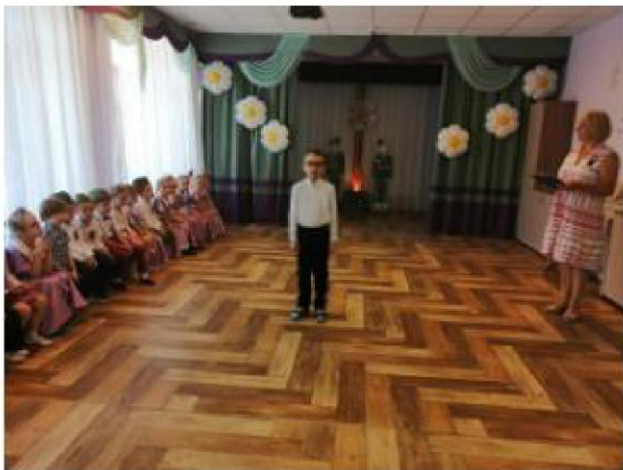
Фото к праздничному концерту